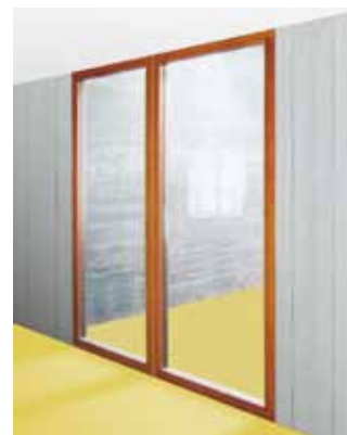
VKF geprüft und zugelassen